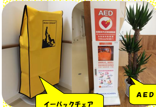
イーバックチェア