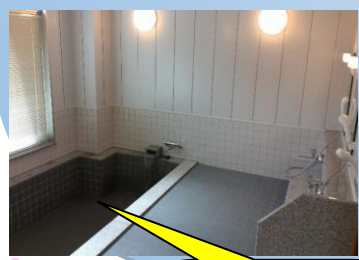
とても広い入浴場