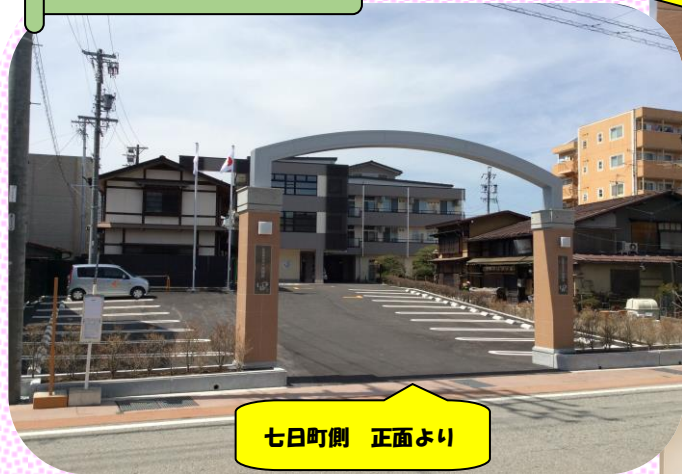
七日町側 正面より