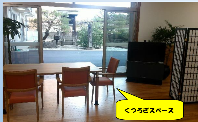
くつろぎスペース

広々としたテイルーム。 5月中旬のオープンに向け、 リハビリの器具や物品を準備中です。