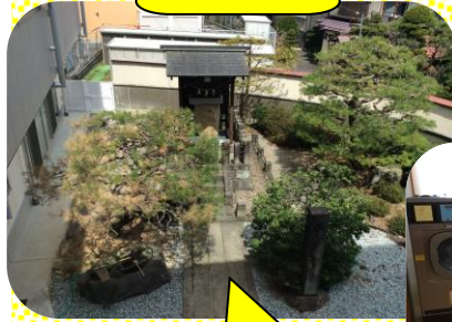
2階から見える秋葉神