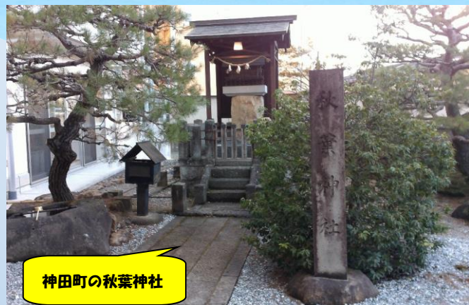
神田町の秋葉神社