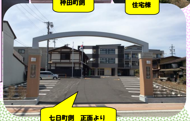
七日町側 正面より